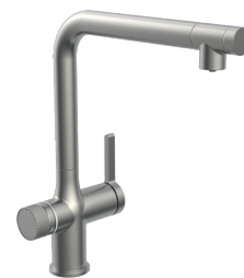
Acier inoxydable, Art. 99905