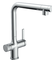
Chromé, Art. 99900

Un design intemporel et élégant combiné à une technologie de pointe. L' AQUASTAR PREMIUM est disponible dans les couleurs tendance chrome, acier inoxydable et noir mat.