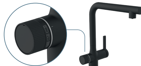
Noir mat, Art. 99960